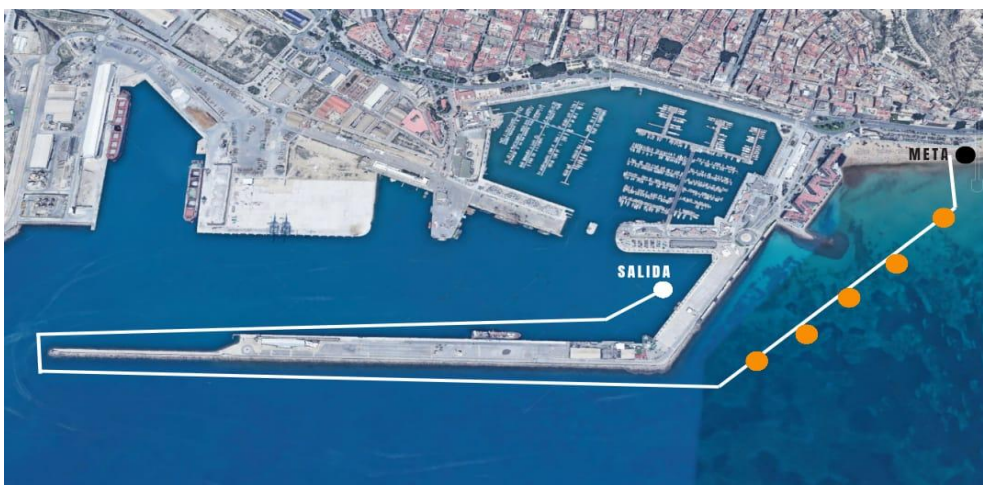
Plano del recorrido travesía infantil 400 metros (8 a 13 años)